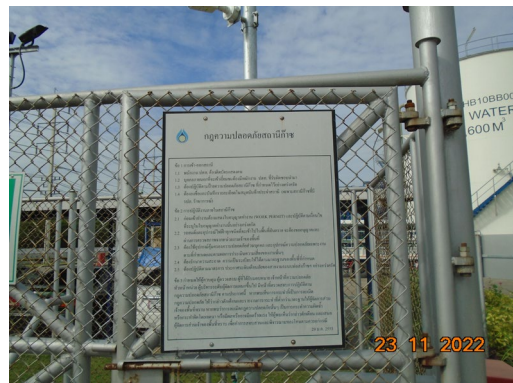
ภาพที่ 1.4-1 สภาพทั่วไปของแนวท่อส่งก๊าซธรรมชาติและสถานีควบคุมความดันและปริมาณก๊าซธรรมชาติ